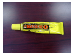
おすすめのボンド